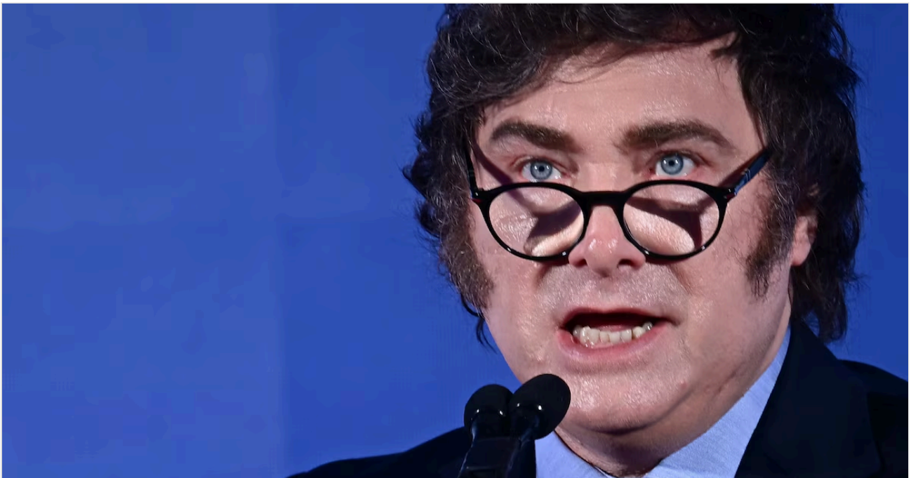
Le président argentin Javier Milei s'exprime lors d'une réunion à Rome, le 14 décembre 2024

OFFRE EXCEPTIONNELLE : dès 1€ le premier mois